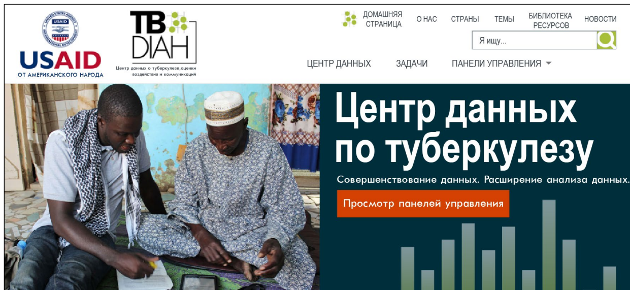
Рис. 4. Домашняя страница центра

Данная публикация была подготовлена при поддержке Агентства США по международному развитию (United States Agency for International Development, USAID) в соответствии с условиями присуждения гранта № 7200AA18LA00007 Центром данных о туберкулезе, оценки воздействия и коммуникаций (TB Data, Impact Assessment and Communications Hub, TB DIAH). Функционирование центра TB DIAH обеспечивается Университетом Северной Каролины в Чапел-Хилл в партнерстве с John Snow, Inc. Выраженные мнения могут не совпадать с мнением USAID или правительства США. FS-20-508 TB, редакция от 2021 г.