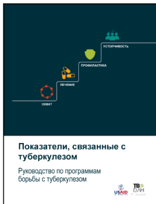
Рис. 3. Руководство по показателям, связанным с туберкулезом

Руководство рекомендует последовательно применять показатели для мониторинга и оценки инвестиций USAID в странах, имеющих приоритет в борьбе с туберкулезом.