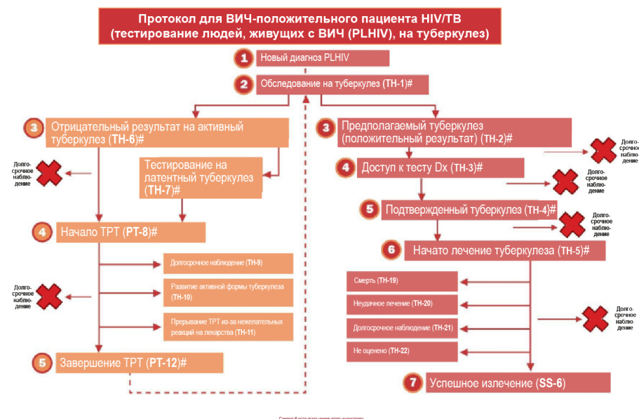
Рис. 2. Пример каскада борьбы с туберкулезом: протокол для ВИЧ-положительного пациента HIV/TB

охвата каждого человека с туберкулезом, лечения всех нуждающихся и предотвращения распространения этого заболевания и появления новых инфицированных. Система также может помочь в выявлении проблем при реализации подхода USAID «Глобальное ускорение в борьбе за искоренение туберкулеза» и достижении целей UNHLM и NPT. Эти данные послужат для стран и USAID фактологической базой при принятии решений по финансированию и разработке программ.